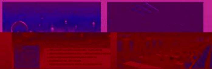
图 5-1-1 工程实践创新项目